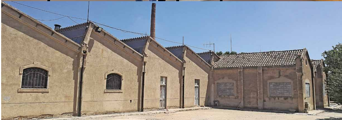
A dalt, recreació virtual de l'interior del Centre d'Interpretació del Tèxtil, segons el projecte de museïtzació. A baix, part de la façana que serà rehabilitada